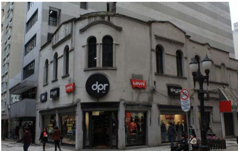
FIGURA 13 – Edificação mista (comercial e residencial) adaptada para uso comercial próxima a Praça Osório