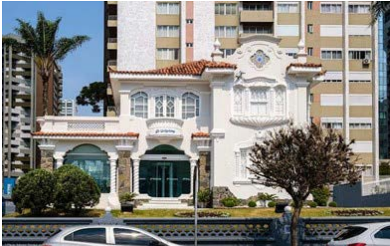
FIGURA 12 – Exemplar de casarão neocolonial na Rua Visconde de Guarapuava