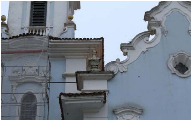
FIGURA 16 - Detalhes de beirais e adornos que remetem às igrejas barrocas