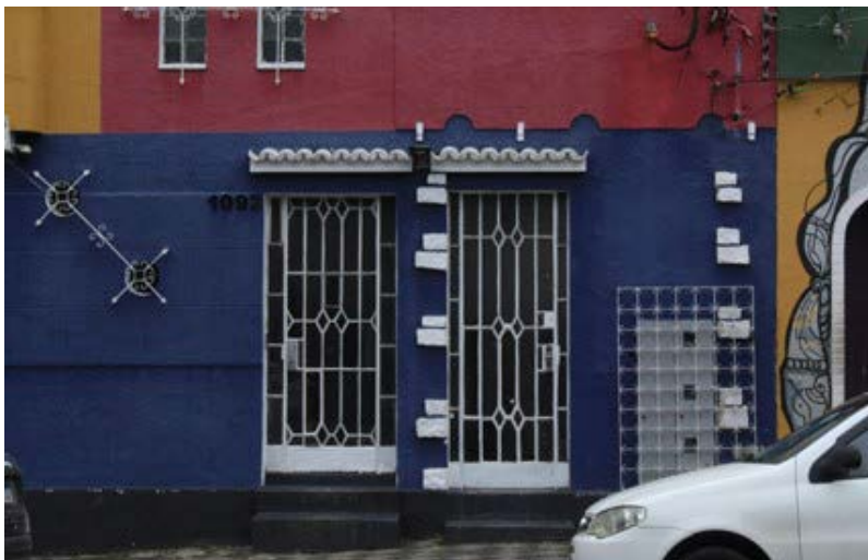
FIGURA 7 – Detalhes em pedra

Este conjunto não possui o embasamento comum nas edificações neocolônias curitibanas, com acabamento de pedra ou similar, mas apresenta detalhes em pedras em volta de uma das portas da fachada, que foram posteriormente pintados de branco.