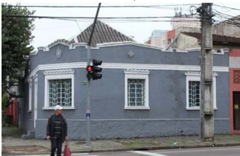
FIGURA 8 – Residência neocolonial presente na Rua 24 de Maio

Um dos principais exemplares encontrados durante a pesquisa de campo foi uma residência de esquina, localizada na Rua 24 de maio, apresenta várias características desse estilo, dentre elas, os frontões triangulares com detalhes feitos de telha, que remetem ao estilo barroco, os detalhes das janelas com telhas e verga reta, detalhes de grades metálicas, tanto nas janelas, quanto na platibanda da residência, além do acabamento da base imitando pedras e o telhado de quatro águas.