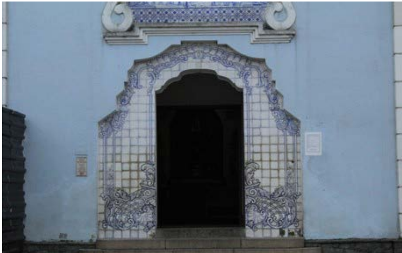
FIGURA 15 - Detalhes dos azulejos