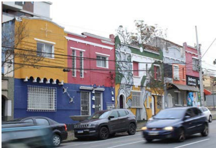
FIGURA 3 – Conjunto neocolonial

Durante o processo de observação empírica, foi possível observar um conjunto de edificações neocoloniais em bom estado de conservação, localizado na Rua 24 de Maio, próximo à Praça Ouvidor Pardinho. Este conjunto ainda mantém muitas das características originais que identificam a arquitetura do estilo neocolonial, por mais que sua cor tenha sido alterada totalmente, os ornamentos e formas ainda trazem consigo os detalhes que afirmam que o conjunto é do estilo procurado.