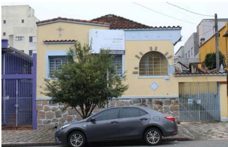
FIGURA 9 – Residência neocolonial na Rua Lamenha Lins