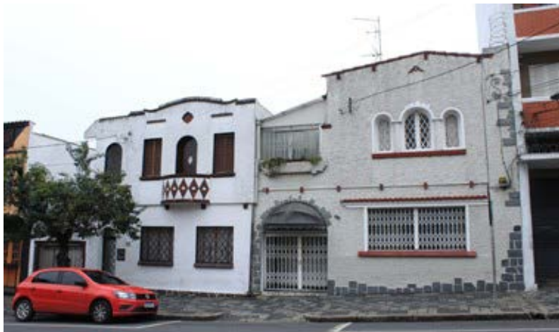
FIGURA 11 – Residências neocoloniais em ótimo estado de preservação na Rua Trajano Reis

das residências neocoloniais foram construídos na mesma época, pois não há registros suficientes que comprovem a presença desses elementos durante sua construção. A cor da fachada, por exemplo, é um elemento que possivelmente foi alterado várias vezes ao longo do tempo. Essa afirmação é possível devido à boa qualidade da pintura que se faz presente nos dias de hoje.