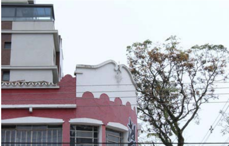
FIGURA 6 – Detalhe do frontão.