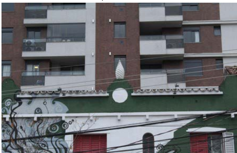
FIGURA 5 – Detalhe de um pináculo decorativo