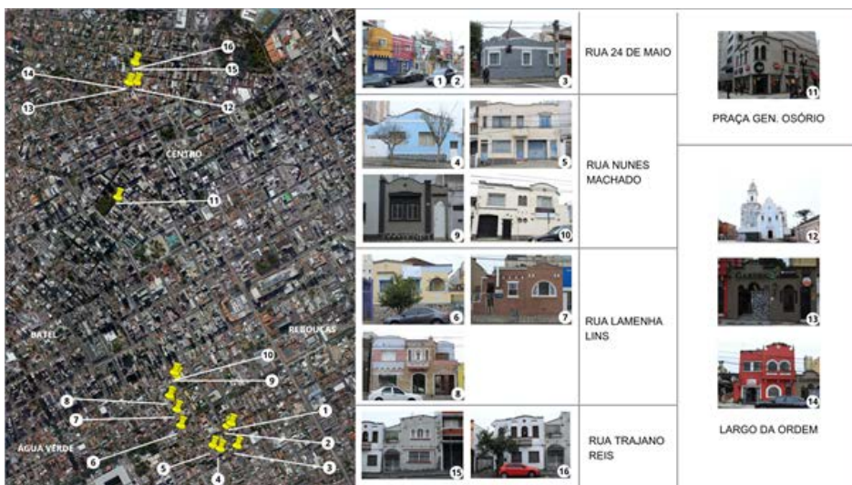
FIGURA 2 – Localização dos exemplares analisados

A escolha da área central se justifica pelo fato de ser o primeiro território com ocupação urbana mais antiga da cidade e deste modo, possui uma diversidade de edifícios construídos em tempos distintos.