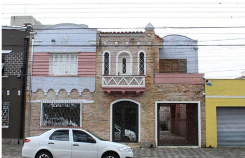
FIGURA 10 – Residência neocolonial na Rua Lamenha Lins com varanda no segundo pavimento

Esta residência por exemplo, apresenta o telhado de quatro águas, as janelas com arco ou verga reta, detalhes com telha por toda a fachada, mas diferente da citada anteriormente, entretanto, soma elementos como, detalhes de pedra circulando a abertura da varanda, a varanda em si e um pequeno pináculo acima de uma coluna.