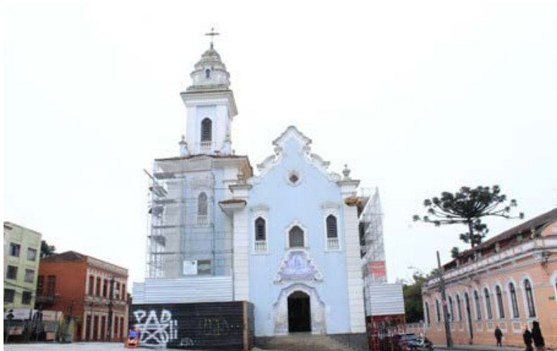
FIGURA 14 – Igreja da Nossa Senhora do Rosário

A linguagem formal da igreja expressa um retorno intencional às referências do período Brasil colônia, com o objetivo de reafirmar uma identidade cultural nacional baseada na época em questão. A fachada é caracterizada por um frontão curvo com volutas laterais, elemento de forte influência barroca, além da presença de uma única torre sineira lateral com cúpula em pinha, retomando composições típicas de igrejas coloniais. As aberturas em verga curva (arco abatido), as molduras salientes ao redor das janelas e o uso de revestimento em cal branca (adaptado para tinta comum atualmente) acentuam a sobriedade e a solenidade do conjunto, reforçando a simbologia tradicionalista atribuída ao estilo.